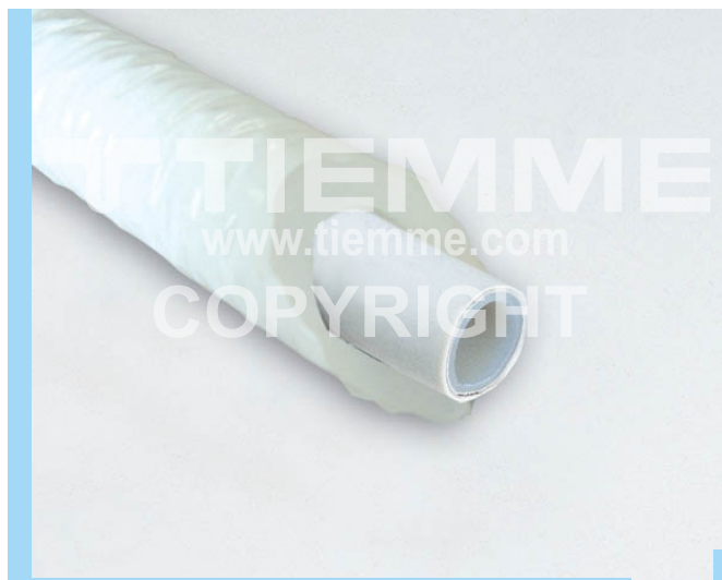
Per la gamma completa vedere il catalogo / For complete range see catalogue

Multilayer pipe with PE-LD coating for heating systems with an high resistance to steam diffusion.