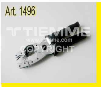
Cesoia taglia tubi Ø14+Ø20 Pipe cutter Ø14+Ø20