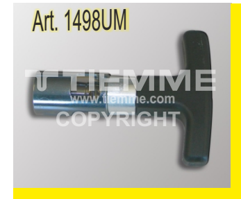
Utensile calibratore/sbavatore con impugnatura fissa Deburring tool with fixed "T" handle