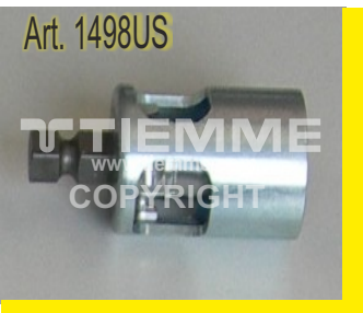
Utensile calibratore/sbavatore intercambiabile Interchangeable deburring tool