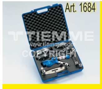
Set per curvatura tubi Pipe bending set