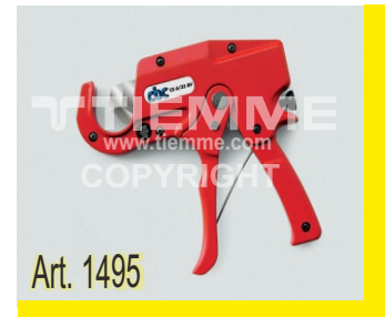
Cesoia taglia tubi Ø0+Ø35 Pipe cutter Ø0+Ø35