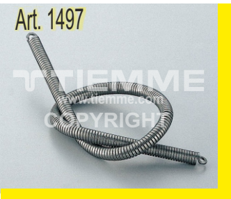
Molla curva tubo Pipe bending spring