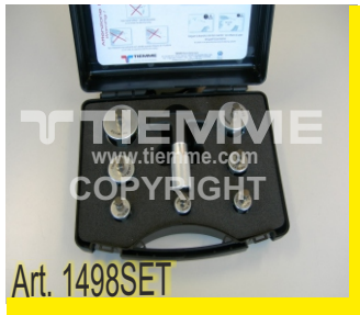
Set calibratori/sbavatori Ø14+Ø40 Pipe deburring tool set Ø14+Ø40