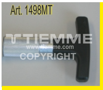
Impugnatura a "T" intercambiabile Interchangeable "T" handle