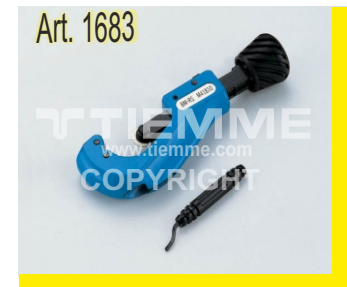
Cesoia taglia tubo con sbavatore Pipe cutter with cleaner