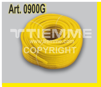
Guaina corrugata gialla Corrugated yellow sheath

Accessori (vedere il catalogo per ulteriori dettagli) Accessories (see catalogue for further details)