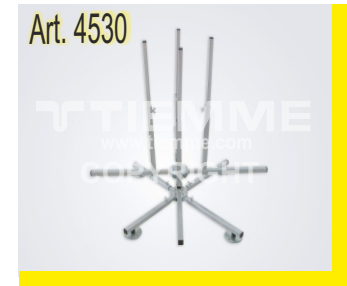
Srotolatore tubo Pipe decelerator

TIEMME Raccorderie S.p.A. si riserva di apportare modifiche in qualsiasi momento senza preavviso. TIEMME Raccorderie S.p.A. reserves the right to modify contents in any time without prior advise. È vietata qualsiasi forma di riproduzione, se non autorizzata. Is forbidden any reproduction unless under TIEMME authorization