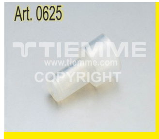
Calza in PVC trasparente Transparent PVC seal