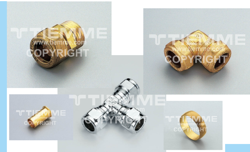
Per la gamma completa vedere il catalogo / For complete range see catalogue

The compression fittings with brass ring are suitable for domestic and commercial plumbing, industrial and agricultural application, heating and sanitary system, pneumatic systems, natural gas, oils and generally with every non aggressive fluid. The fittings may be also used for solar systems.