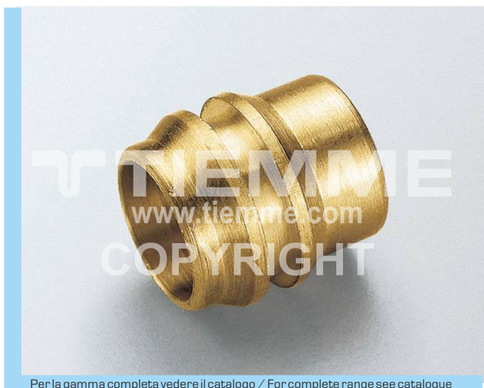
Per la gamma completa vedere il catalogo / For complete range see catalogue

Reducing bush art. 1147G is suitable only for copper pipes or calibrated steel pipes; for any other application please contact our Technical Service. The bush must be lubricated with potable oil or grease in order to allow a more uniform strain and also to obtain an easier assembling.