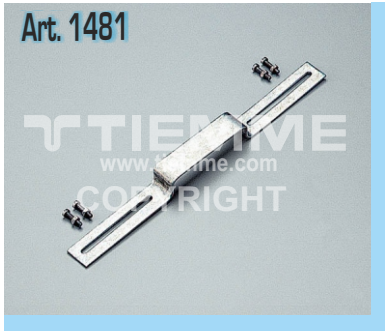
Staffa per curve flangiate Art. 1406 Bracket for wallplate elbow Art. 1406