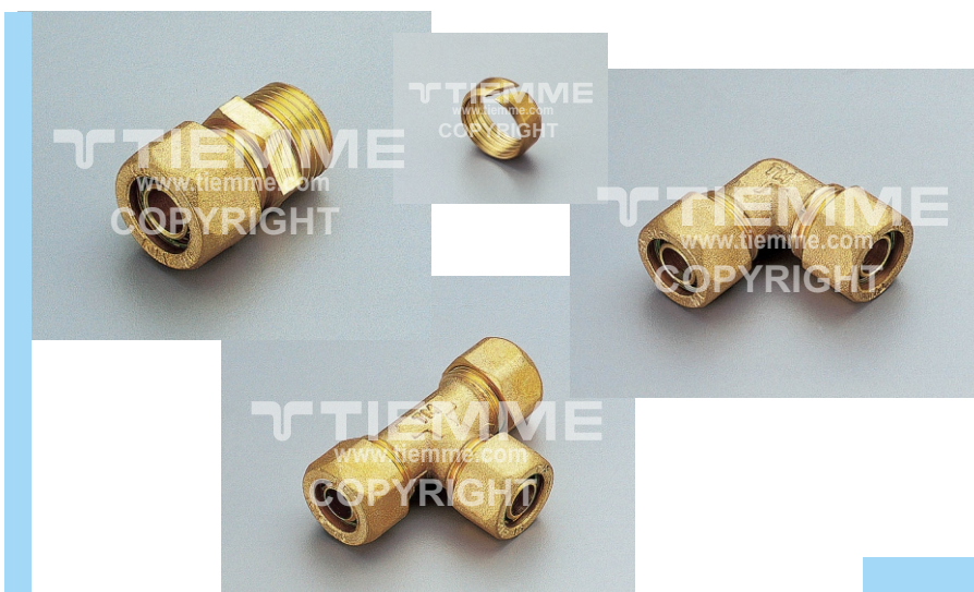
Per la gamma completa vedere il catalogo / For complete range see catalogue

The compression fittings with brass ring for EVOH Pe-X pipe are suitable for domestic and commercial plumbing, industrial and agricultural application, heating and sanitary system, pneumatic systems, natural gas, oils and generally with every non aggressive fluid.