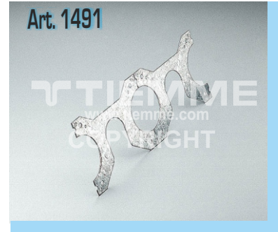
Staffa doppia frazionabile Double divisible bracket