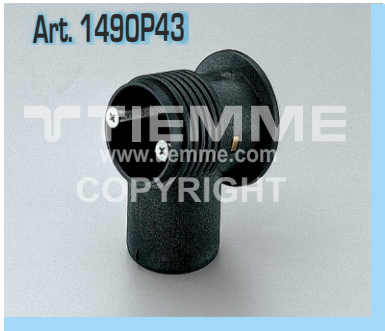
Box in plastica per guaina Ø23 e Ø27 Plastic box for Ø23 and Ø27 sheath