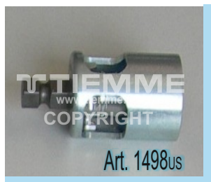
Utensili calibratore/sbavatore intercambiabili per utilizzo con trapano o articolo 1498MT (disponibili nelle misure Ø14+Ø63) Interchangeable deburring tools to be used with drill machine or article 1498MT (available on size Ø14+Ø63)