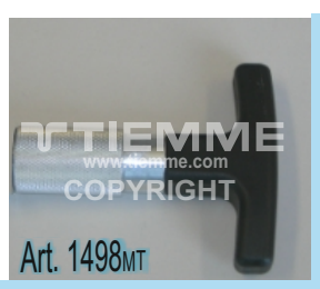
Impugnatura a "T" intercambiabile (per utilizzo con articolo 1498US) Interchangeable "T" handle (to be used with article 1498US)