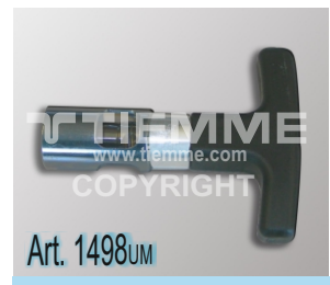
Calibratori/sbavatori con impugnatura fissa (disponibili nelle misure Ø16+Ø32) Deburring tools with fixed handle (available on size Ø16+Ø32)