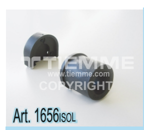
Set per isolamento acustico dei raccordi con flangia Art. 1656 Acoustic insulating set for fittings with flange Art. 1656

TIEMME Raccorderie S.p.A. si riserva di apportare modifiche in qualsiasi momento senza preavviso. TIEMME Raccorderie S.p.A. reserves the right to modify contents in any time without prior advise. È vietata qualsiasi forma di riproduzione, se non autorizzata. is forbidden any reproduction unless under TIEMME autorization