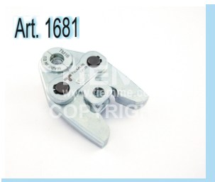
Pinze "TM" per pressature "TM" pressing tongs