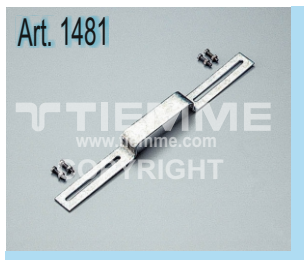
Staffa per curve flangiate Art. 1406 Bracket for wallplate elbow Art. 1406