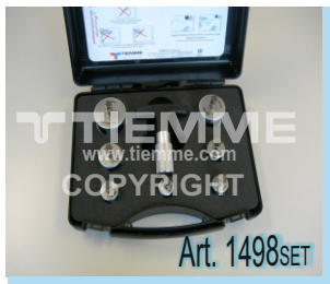
Valigetta con set calibratori/sbavatori Ø14+Ø40 Box with deburring tools set Ø14+Ø40