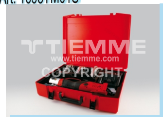
Pressatrice a batteria Battery crimping machine