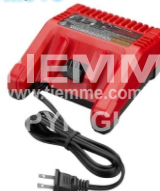
Caricabatteria per art. 1695TM01B Battery charger for art. 1695TM01B