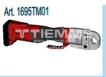
Pressatrice a batteria Battery crimping machine