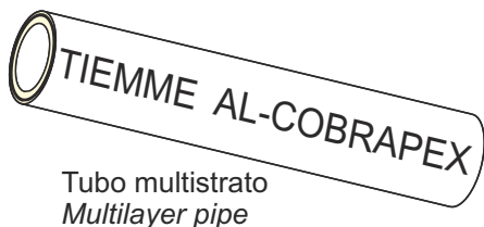
Tubo multistrato Multilayer pipe

Esempio di applicazione Installation using