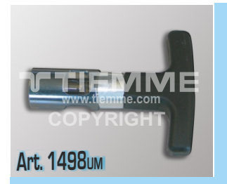
Calibratori/sbavatori con impugnatura fissa (disponibili nelle misure Ø16+Ø32) Deburring tools with fixed handle (available on size Ø16+Ø32)