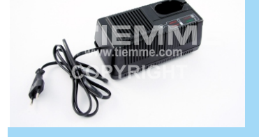
Caricabatteria per art. 1695TM01B Battery charger for art. 1695TM01B