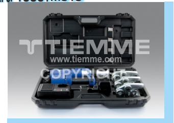
Pressatrice a batteria Battery crimping machine