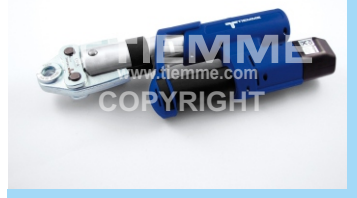
Pressatrice a batteria Battery crimping machine