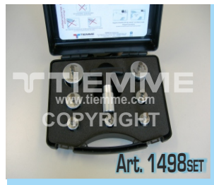
Valigetta con set calibratori/sbavatori Ø14+Ø40 Box with deburring tools set Ø14+Ø40