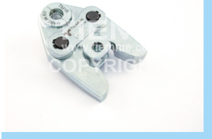
Pinze "TM" per pressature "TM" pressing tongs