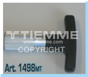
Impugnatura a "T" intercambiabile (per utilizzo con articolo 1498US) Interchangeable "T" handle (to be used with article 1498US)