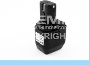
Batteria per pressatrice Battery for crimping machine