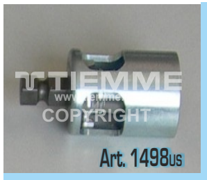
Utensili calibratore/sbavatore intercambiabili per utilizzo con trapano o articolo 1498MT (disponibili nelle misure Ø14+Ø63) Interchangeable deburring tools to be used with drill machine or article 1498MT (available on size Ø14+Ø63)