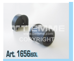
Set per isolamento acustico dei raccordi con flangia Art. 1656 Acoustic insulating set for fittings with flange Art. 1656

TIEMME Raccorderie S.p.A. si riserva di apportare modifiche in qualsiasi momento senza preavviso. TIEMME Raccorderie S.p.A. reserves the right to modify contents in any time without prior advise. È vietata qualsiasi forma di riproduzione, se non autorizzata. is forbidden any reproduction unless under TIEMME autorization