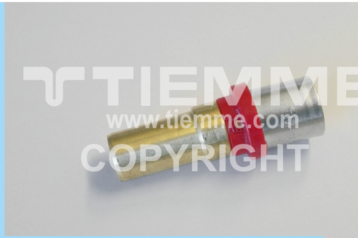
Per la gamma completa vedere il catalogo / For complete range see catalogue