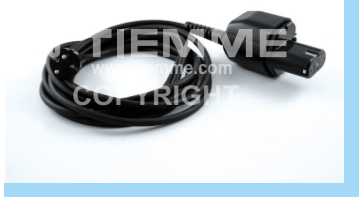
Adattatore di rete 230 Vac 230Vac adaptor suitable